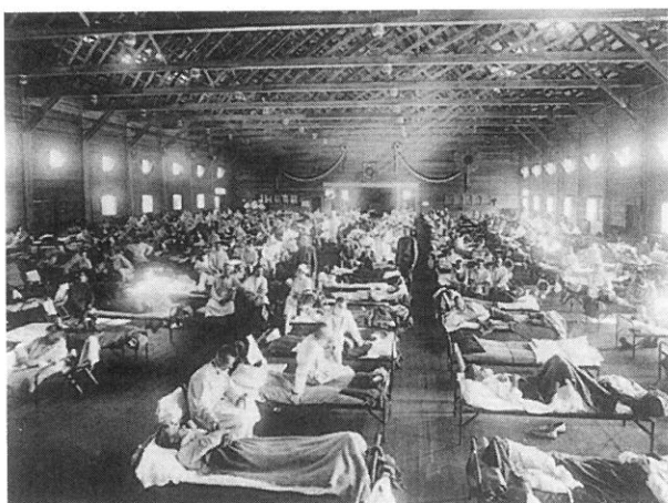
Fig. 1 Emergency hospital during influenza epidemic, Camp Funston, Kansas.