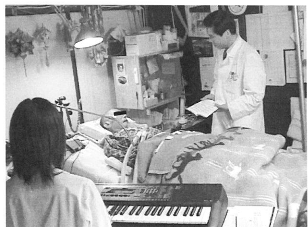
図 2 B氏宅での音楽療法 (bedside singing)

C氏は69歳で発症、2年4ヵ月で呼吸器を装着し、2ヵ月後に在宅療養に移行した。当初、上肢は完全麻痺だが、