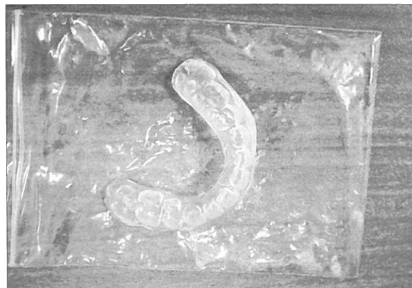
Fig. 4 Mouthpiece for a therapy of traumatic ulcers.

ロキソプロフェンナトリウム 1錠屯用 6 回分の処方を受けた。10月22日当院退院となった。10月27日の夕方口内痛は改善せず、10月28日に厚生連高岡病院歯科口腔外科を再度受診した。咬傷部分の歯の接触を緩衝するために