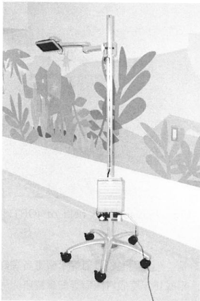
Fig. 2 Portable LCD-DVD system for pediatric radiotherapy.