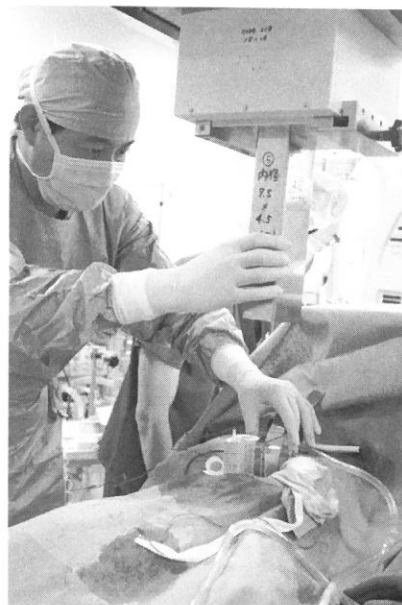
Fig. 6 Intraoperative radiotherapy (IORT).