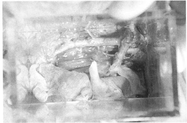
Fig. 7 Irradiation field of IORT.

以上に当院の小児放射線治療を紹介した. 安全で精度の高い放射線治療を行うためには, 手間と工夫を要するが「それだけのことはある」というが実感である. とはいえ, 小児放射線治療は付きそう医師・看護師などのスタッフのマンパワーが要求される. 永田らによる全国調査 2) では, 成人の場合に比べておよそ2-3倍の手間がかかるとされており, 近い将来, 治療実態に見合った診療報酬への加算が期待される.