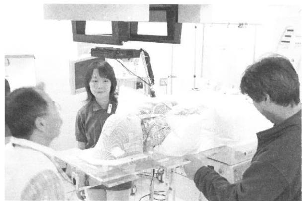
Fig. 1 Irradiation positioning. Body was in the fixation bag and the face mask was attached.

患児の正面に置き，好きなビデオを見てもらう．写真 (Fig. 2) は，大型液晶モニター用を保持できるアームシステムに小型液晶画面 (Fig. 3) と車載型DVDプレーヤー (Fig. 4) をセットしたシステムである．恐怖感がおこりそうな場合は，予め数日にわたり母親と放射線治療室に「遊びに来て」もらう．これらにより，当院では2歳以上の全例でビデオ鑑賞により治療協力を得ている．残念ながらビデオに興味の持てない2歳未満では，麻酔科の協力により全身麻酔下で治療を行っている．当