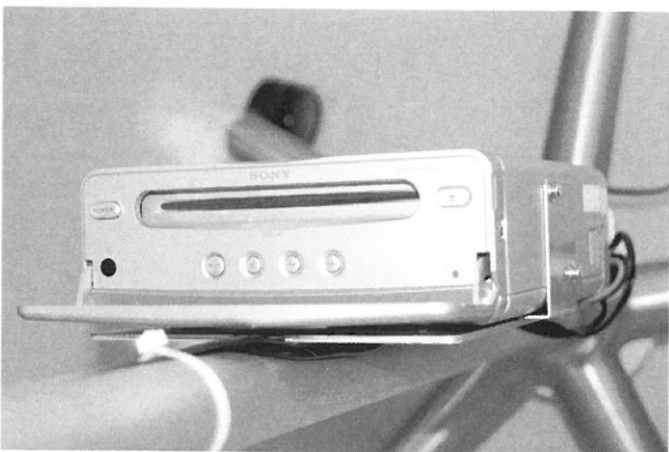
Fig. 4 Vibration-resistance portable DVD player.

院の放射線治療は、このどちらかの方法であり、経口や経静脈の鎮静剤投与による「鎮静」は行っていない。ビデオというささやかな楽しみと丁寧に対応することで子供は協力してくれる。もうひとつの「ささやかな楽しみ」として「通い帳」(Fig. 5) とたくさんのシールを治療室の入り口に用意している。