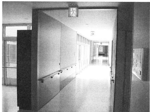
図3 老健施設「風の杜」の廊下。左手前に水平区画の防火戸。その奥に防災バルコニーに面する掃き出し窓があるが、防災バルコニーは廊下の採光・開放感の向上にも役立っている。

病院で実際に災害予防や危機管理にあたるのは病院管理者自身であるにしても、その方法の整備には、基本的に防災専門家の積極的な関与が必要であろう。また、機能的な危機管理を行えるようにするには建築にもそれなりの工夫が必要だから、設計者とのコミュニケーションも欠かせない。現在の病院のあり方をもとに、その基盤を整えていくには、第1に、建った後の病院が、防災や日常的な使い勝手から見てどのように管理されているかを病院関係者と防災・建築計画の間の協力によって把握していく必要がある。さらに、既存・新築を問わず、施