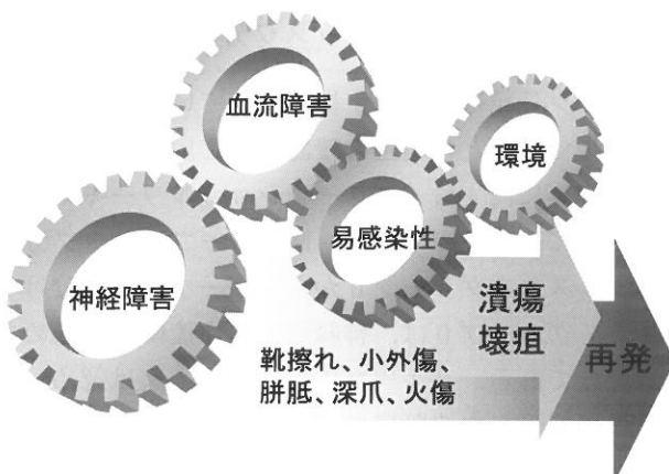
図1 糖尿病性足潰瘍・壊疽の発症・憎悪機序