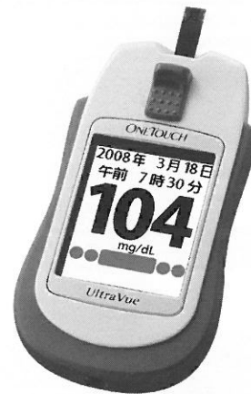
ワンタッチウルトラビュー™

市場調査および医療従事者の方々からのフィードバックにより、日本の糖尿病患者の中には比較的高齢者の方々が多く、そのため、視力の低下や手が震えて細かい操作ができないなど、操作や結果の解釈に周囲の助けを必要としている方がいるということが明らかになりました。また、糖尿病と診断された方々は、食事療法・運動療法および、インスリンデバイスの使用方法など、数多くのことを覚える必要があります。そのことが自己血糖測定器を使いこなすことへの障害の一因になっていることがわかりました。このような日本の市場ニーズを洗い出し、それを解決するための測定器を開発すべく、日・米・独・伊の関係者を集めた開発チームが結成され、ワンタッチウルトラ™の精確さと使いやすさを兼ね備えながらさらに優れた機能を持つメーター、すなわちワンタッチウルトラビュー™の開発プロジェクトが始動いたしました。