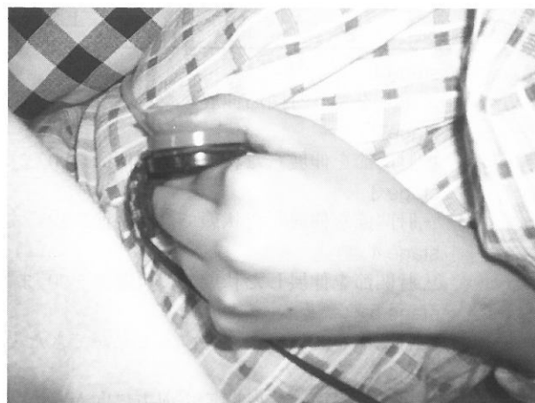
b stage12: 左母指によるスペックスイッチの操作