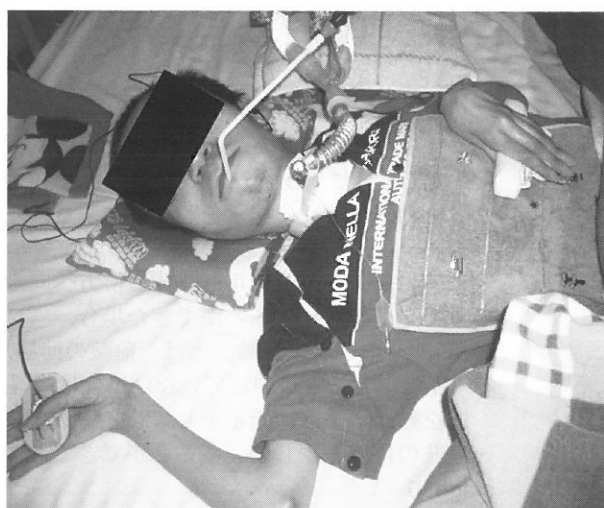
d stage12: 右手母指によるピルケース型スイッチと呼気によるセンサー式のブレススイッチの操作

stage10は、リーチ範囲内にセッティングする必要がある。stage11以降は、手指から離れないように紐やベルクロ、ホースなどで固定する。stage12以降から、ブレスなどのセンサー式スイッチなどの導入の検討が必要である。進行によって変形や筋力低下により、動く範囲が狭くなるため、スイッチが指の間に入りづらくなる。