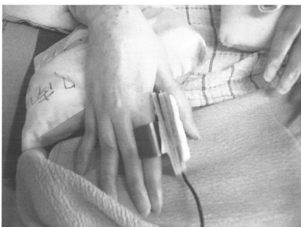
c stage12: 左母指によるピルケース型スイッチの操作