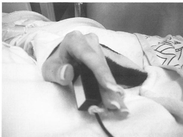
a stage11: 左母指によるマイクロライトスイッチの操作