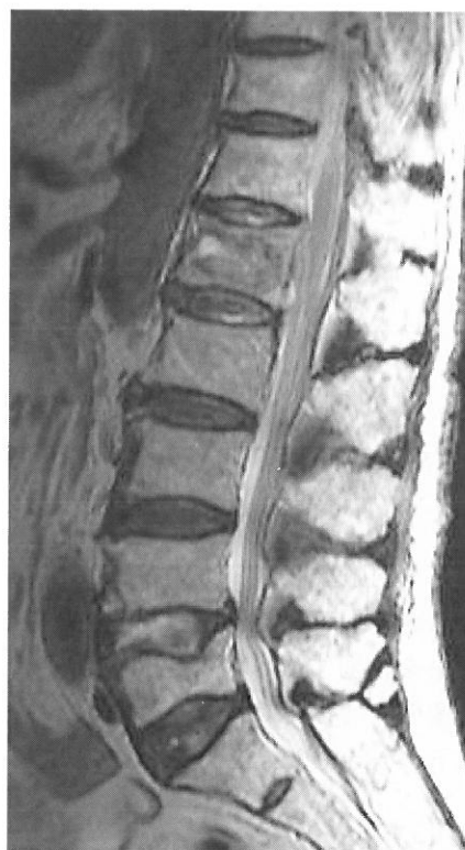
図2 d MRI T2WI：第1腰椎に高信号域を認める。第5腰椎は等信号