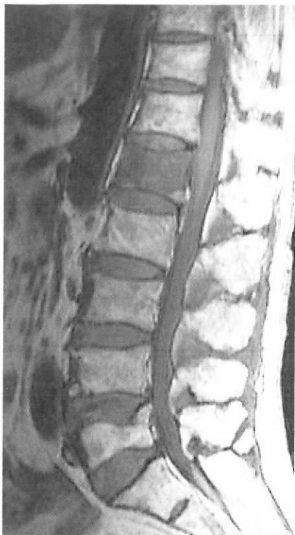
図2 c MRI T1WI：第1腰椎は低信号，第5腰椎は等信号