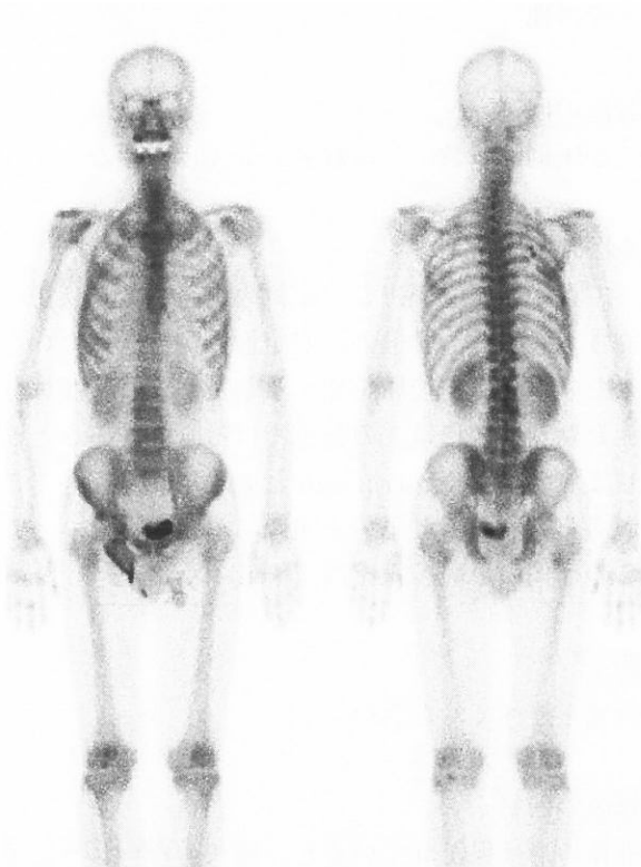
図1 c 骨シンチ：上位腰椎右側に異常集積

影の消失を第2腰椎の右に認めます。鑑別疾患として転移性腫瘍を第一に挙げましたから、見逃してはいけない所見ですね。