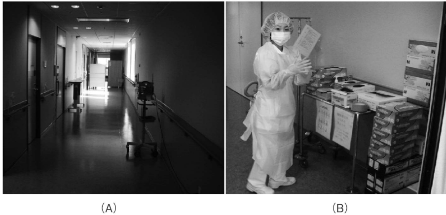
図2 個室管理と整備した物品

(A) 人通りが最も少ない廊下の突き当たりに準備した個室。この通路に沿った部屋は閉鎖した。 (B) MDRA 保菌者の個室につながる廊下の一番手前で整備したガウン、手袋、マスク等。