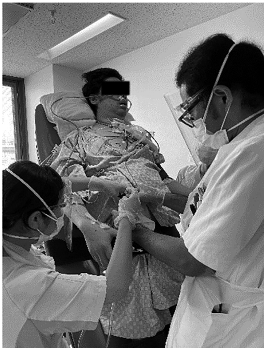
図2 ICU早期離床リハビリチーム介入の実際 ①ティルトテーブルによる立位訓練