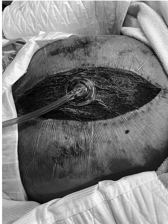
図1 腹部開放創陰圧閉鎖キット（ABTHERA®）導入の実際