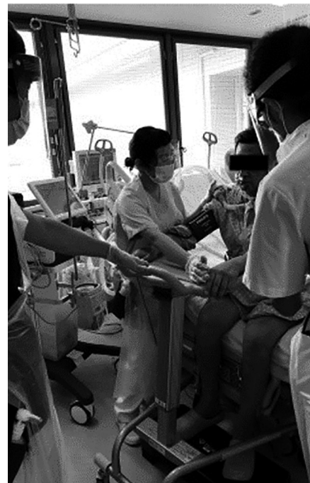
図3 ICU早期離床リハビリチーム介入の実際 ②端坐位，立位訓練